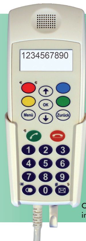
CP 200 IP im Köcher