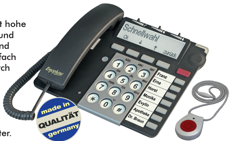
Funk-Handsender TRX mit Kordel im Lieferumfang.

Das „Ergophone S 510 Funk“ erfüllt hohe Ansprüche an Qualität, Flexibilität und Zuverlässigkeit. Es lässt sich aufgrund der durchgehenden Ergonomie einfach und intuitiv bedienen und kann durch zahlreiche Funk-Zusatzgeräte zu einem umfassenden Notrufsystem erweitert werden. Sondervarianten des Telefons erlauben die Integration von drahtgebundenen Rufauslösern wie Birn- oder Zugtaster.